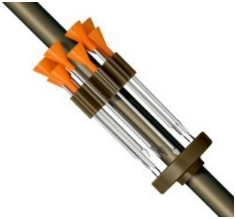
Pfeilhalter jeglicher Art