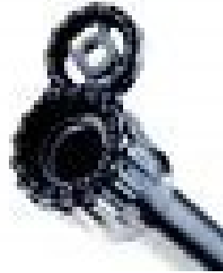
Zielvorrichtungen jeglicher Art